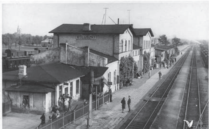
Dworzec w 1941 r., na 1. Planie widoczny żuraw wodny, za dworcem widać drewniany barak z 1916 r. po zmianie elewacji.

Z uwagi na zniszczenie wież wodnych w ramach działań wojennych postanowiono wznieść nową wieżę ciśnieniową. Pobudowano ją w latach 1927 – 1928 w najnowszej części osiedla kolejowego według typowego projektu w stylu architektury obronnej. Szkielet wieży wykonany jest z żelbetonu, a ściany wypełnione są cegłą i kamieniami. Początkowo posiadała szpiczasty dach, rozebrany w 1939 r. Co ciekawe koluszkowska wieża posiada bliźniaczkę w Skierniewicach i na stacji Kutno – Azory. Jedyną zmianą jaka zaszła wśród budynków dworcowych w latach 1918 – 1939 to zmiana funkcji poniemieckiego baraku. Zaadoptowano go na potrzeby poczekalni dworcowej, przechowalni bagażu oraz innych funkcji. Zmodernizowano