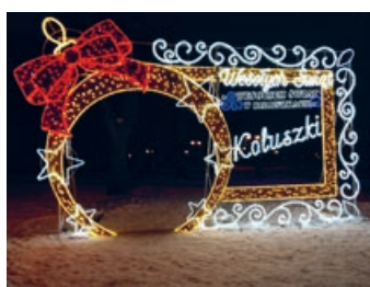
Świąteczna ramka do zdjęć w Parku Miejskim w Koluszkach