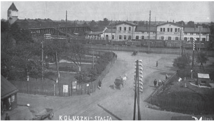
Widok na stację Koluszki w latach 30. XX w. Od lewej widoczna wieża ciśnień, Domy Kolejowe, drewniana kładka, budynek dworca ceglany.

Po ogromnych zmianach jakie przeszła koluszkowska stacja kolejowa, jak i sam dworzec, okres międzywojenny był chwilą stabilizacji na kolei. Przypomnijmy, że Niemcy spalili większość zabudowań stacyjnych w czasie odwrotu. Po wkroczeniu wyremontowali najstarszy, ceglany dworzec, a w miejscu dworców drewnianych wybudowali długi drewniany barak. Naprawili również drewnianą kładkę. Po odzyskaniu niepodległości cały majątek kolei państwowych znalazł się w trwałym zarządzie Polskich Kolei Państwowych. Jedyne prywatna (w 1914 r.) Kolej Fabryczno Łódzka pozostała w tymczasowej eksploatacji aż do 1931 r., kiedy to PKP ją wykupiły.