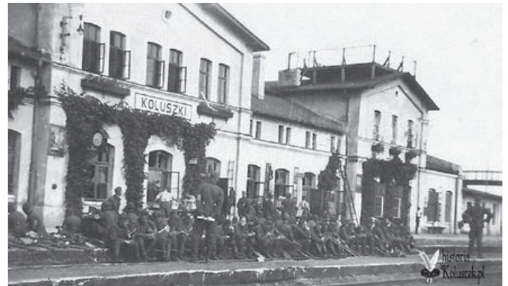
Budynek dworca późną jesienią 1939 r. lub w 1940 r. Przed dworcem żołnierze niemieckich służb tyłowych, na dachu widoczna platforma przeciwlotnicza.

Koluszki, jako jeden z największych węzłów kolejowych w Polsce, stanowiły ważny obiekt strategiczny we wrześniu 1939 r. Stanowiła o tym obecność dwóch dużych składnic wojskowych (w Gałkowie i Regnach), przydział nowoczesnej baterii przeciwlotniczej do obrony Koluszek, czy chociażby zachowane niemieckie plany ataków w infrastrukturę kolejową. Koniec sierpnia i pierwsze dni września 1939 r. to czas, kiedy przez naszą stację przewijają się olbrzymie ilości wojska. Swoje miejsce dyslokacji otrzymała tu część polskiej odwodowej Armii Prusy.